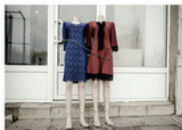
Gavar, Arménie - 20 avril, 2018

Née en 1983, Julie Franchet est une photographe française membre du Studio Hanslucas.