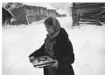
Carélie - Kolodozero / Pogost - 2013

De vieilles mesures destinées à entreposer la nourriture.