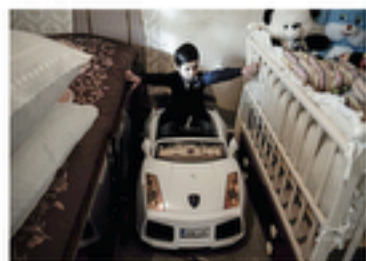
Sarukhan, Arménie - 18 avril, 2018

Les fils sont considérés comme des petits rois dans les familles arméniennes. Ici, l'enfant à peine âgé d'un an est assis sur les genoux de son père pendant que celui-ci conduit.