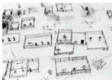
Région de Kostroma, village de Druzhba - 2013