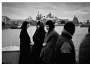
Région d'Arkhangelsk - Iles Solovki - 2013

Bords du lac au coucher du soleil, vers minuit.