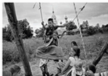
Région de Yaroslavl - Davydovo - 2013

En Carélie, région proche des pays scandinaves, les maisons sont traditionnellement construites en bois.