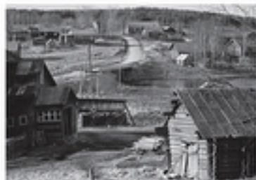
Carélie - Kolodozero / Ust-Reka - 2013

Zakhar fait tous les jours un trajet de 3 km à pied ou à vélo jusqu'à l'école du village. Ses parents ont quitté Tbilissi, la capitale de la Géorgie, pour s'installer dans le petit village de Kolodozero en Carélie.