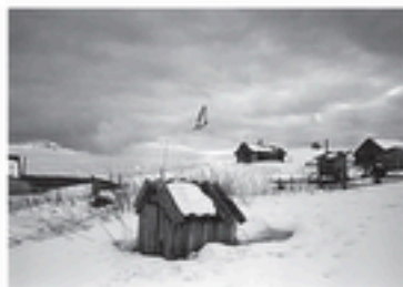
Carélie - Korbozero - 2015

Le monastère de Solovetsky est devenu un lieu de pèlerinage. Dans les années 1920, le premier camp de prisonniers politiques a été établi sur cette île balayée par les vents.