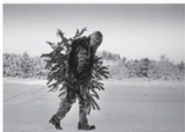
Carélie - Kolodozero - 2016