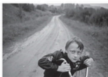
Carélie - Kolodozero / Zaozere - 2012

Photographe russe indépendant et journaliste professionnel Aleksey Myakishev s'inscrit dans le courant de la photographie humaniste. Né en 1971 à Kirov en URSS, il vit à Moscou depuis 1999.