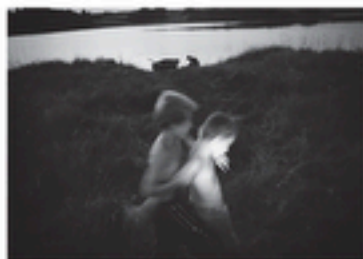
Carélie - Kolodozero / Pogost - 2013

Bords du lac au coucher du soleil, vers minuit.