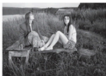
Carélie - Tambichozero - 2011

Jeunes filles se reposant après s'être baignées dans le lac.