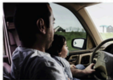
Gegharkunik, Arménie - 04 mai, 2018

Deux mannequins sans tête sont accrochés à la devanture d'un magasin.